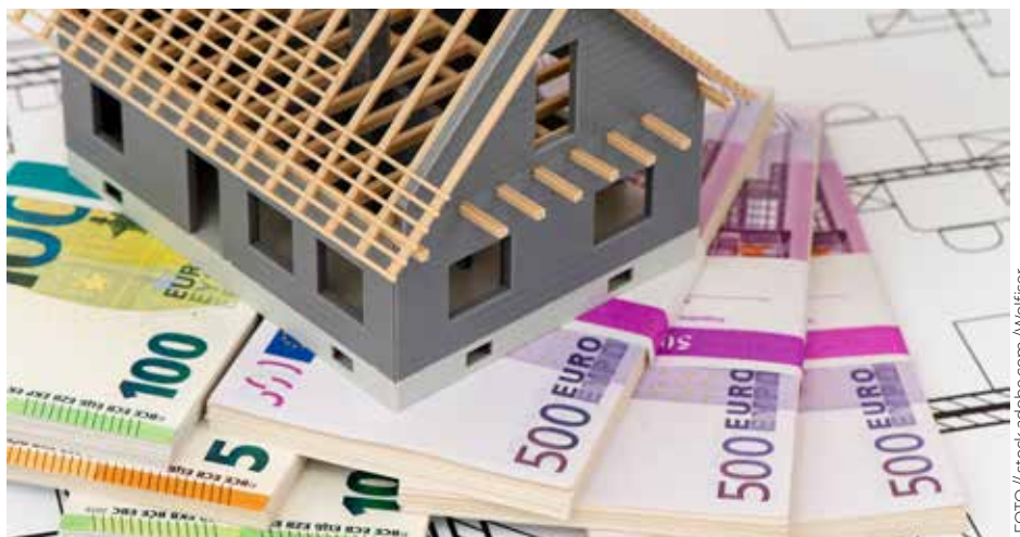
Das abgezweigte Geld aus dem Fördertopf muss dringend in die Revitalisierung des Wohnbaus investiert werden.

Das abgezweigte Geld müsse im Verlauf der nächsten drei Jahre und