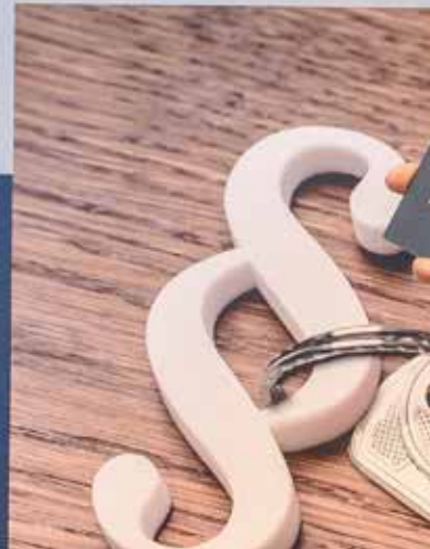
LHStv. Josef Geisler: „Bestehender Wohnraum darf nicht ungenutzt bleiben.“