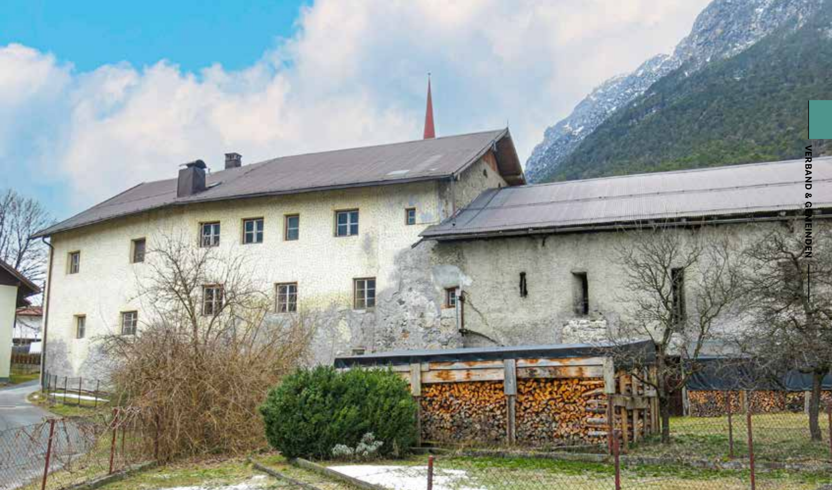
Das von der Gemeinde erworbene Postmeisterhaus eröffnet mit seiner Kubatur baulich extrem viele Möglichkeiten.