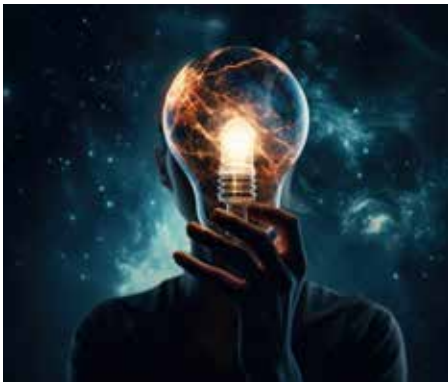
ENERGIEGEMEINSCHAFTEN BRINGEN FÜR DIE GEMEINDEN VIELE VORTEILE