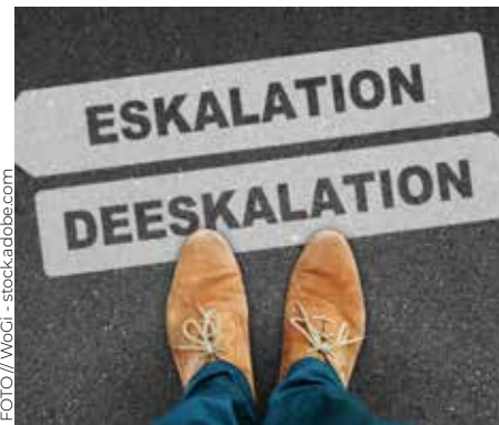
KONFLIKTMANAGEMENT HAT AUCH IN GEMEINDEN EINE HOHE WICHTIGKEIT