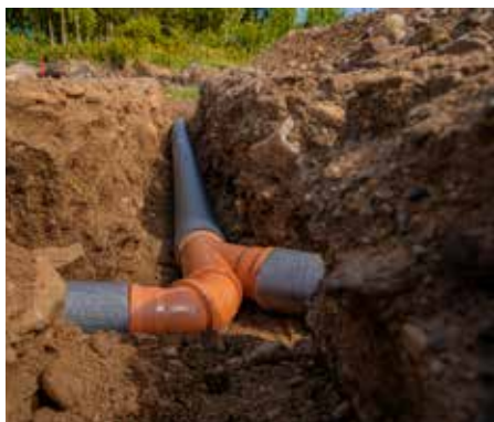
IN SACHEN KANALISATION HABEN DIE GEMEINDEN VIELE PFLICHTEN