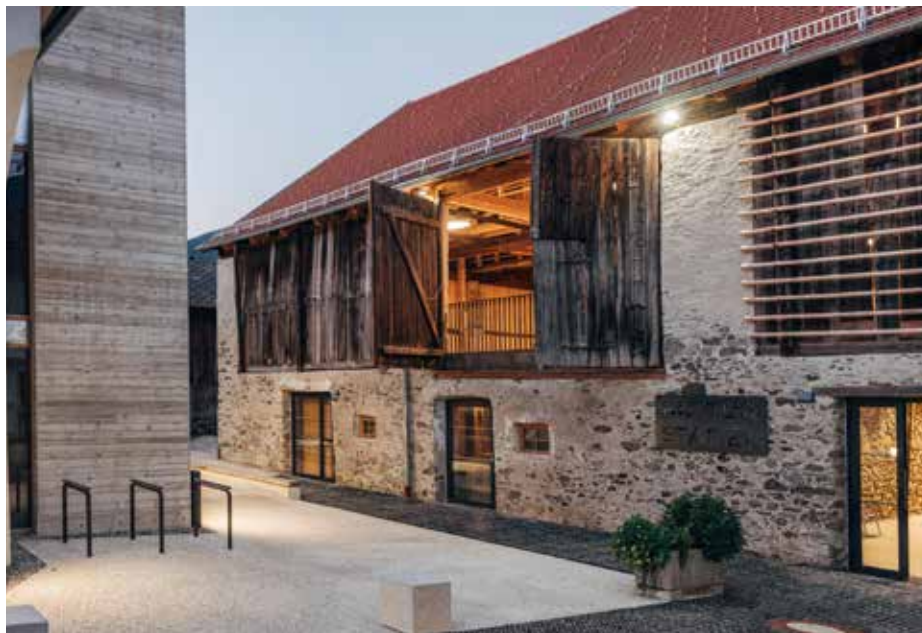
(C) nicolas hafele

Daher müssen zu Beginn der Konzeption die Projektidee sowie die zu erreichenden Ziele eindeutig beschrieben werden. In der Konzeptionsphase werden die Grundlagen für das gesamte Vorhaben, für die Planung, die Umsetzung sowie den Betrieb grob evaluiert und bestimmt. Hierher gehört zudem die Unterscheidung in Hauptfunktionen (Must-haves) und Nebenfunktionen (Nice-to-haves) und deren Bewertung. Am Ende der Initiierungsphase steht die Machbarkeitsprüfung. Jeder Schritt bis dahin ist mittels Entscheidungsbaum überprüfbar: Stimmen Zielsetzung und Ist-Stand überein, geht es weiter (Go), stimmen sie nur partiell überein, müssen die Rahmenparameter entsprechend angepasst werden (Re-define), klaffen Zielsetzung und Rahmenbedingungen zu weit auseinander, sollte das Projekt im Zweifelsfall gestoppt oder von Grund auf neu überdacht werden (No-Go/Exit). „Werden in der ersten Phase alle Aspekte genau betrachtet und definiert, steht die solide Grundlage für die weiteren