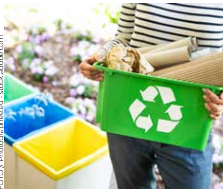
RECYCLING HAT IN DEN TIROLER GEMEINDEN EINEN HOHEN STELLENWERT