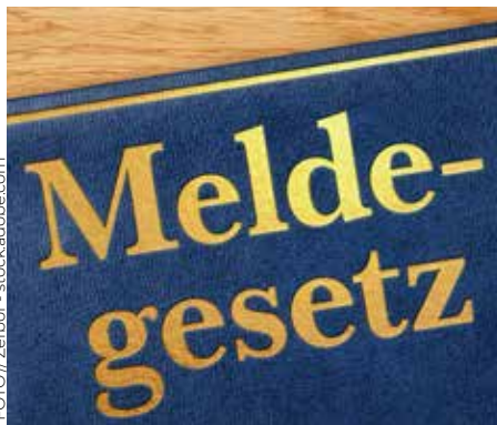
SCHULUNG ÜBER DAS MELDEGESETZ IN THEORIE UND PRAXIS