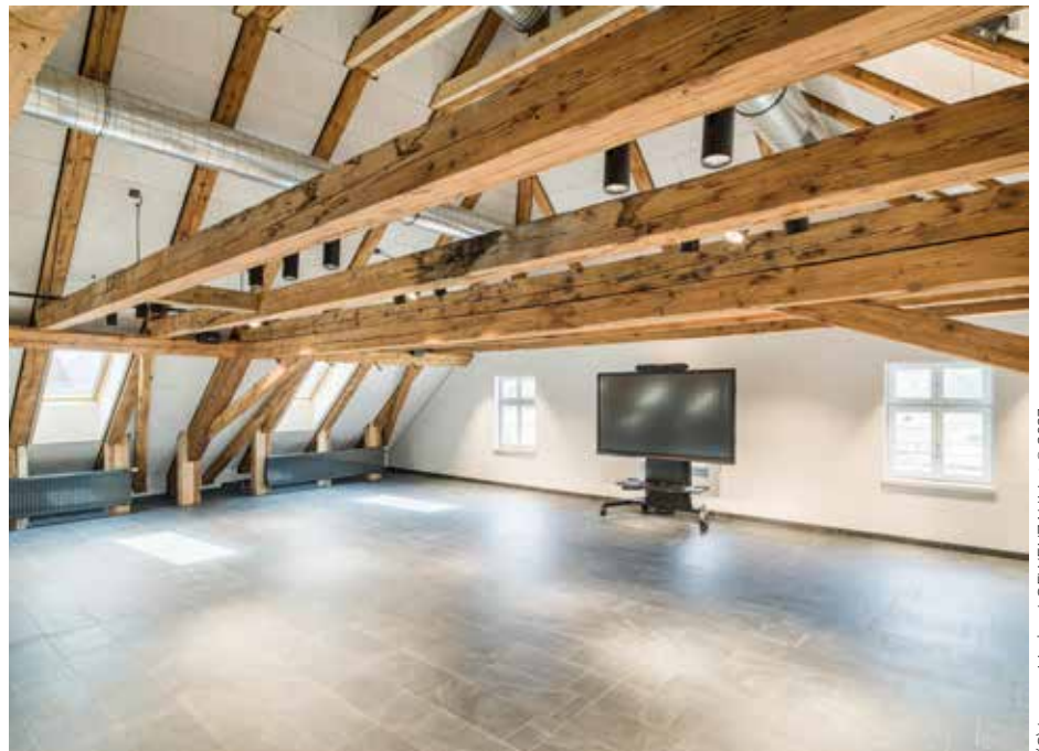
Die Innenräume des neuen Miederer Gemeindefesthauses, hier der multimediale Saal im Dachgeschoss, beeindrucken mit der Kombination aus altem Baubestand und moderner Architektur.

„Die Basis für das Projekt war die hervorragende Zusammenarbeit zwischen Land Tirol, Bundesdenkmalamt und Landesgedächtnisstiftung. Und es