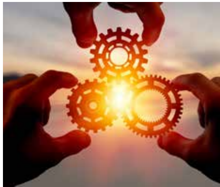
FÜR INNOVATIVE PROJEKTE ERHALTEN GEMEINDEN FÖRDERMITTEL