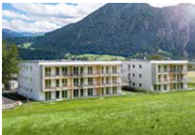
Beste Lage in Münster.