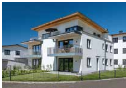
Wohnen mit Qualität in Ebbs.