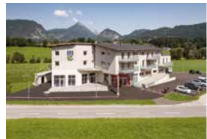
An die Zukunft gedacht in Schwoich.

Jedes Projekt wird individuell auf die Bedürfnisse der Gemeinde abgestimmt.